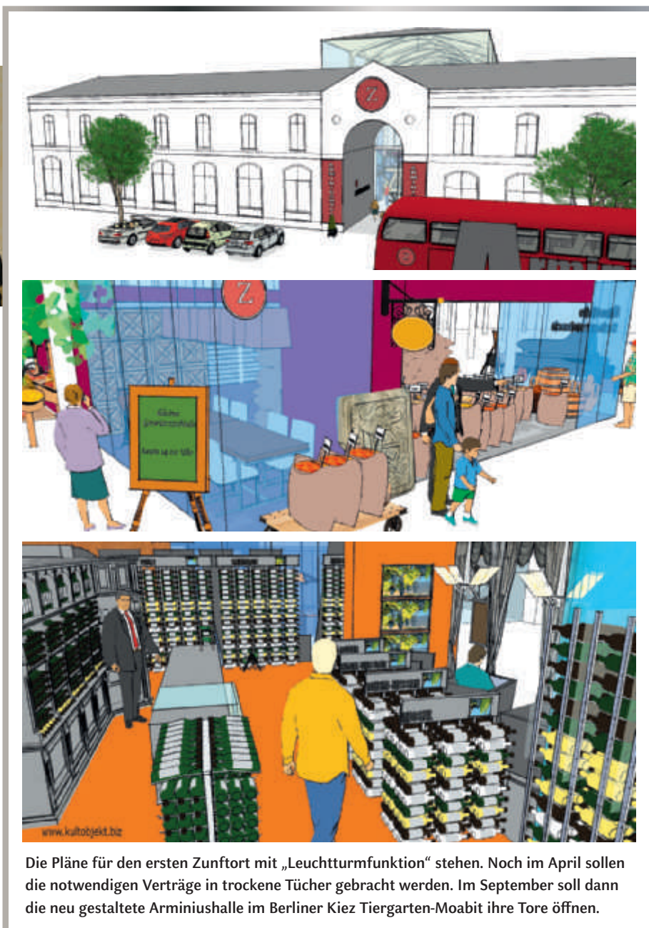
Die Pläne für den ersten Zunftort mit „Leuchtturmfunktion“ stehen. Noch im April sollen die notwendigen Verträge in trockene Tücher gebracht werden. Im September soll dann die neu gestaltete Arminiushalle im Berliner Kiez Tiergarten-Moabit ihre Tore öffnen.

verein in Essen den „Chance Denkmal Award“ der MGG/Ruhrkohle AG sowie im Jahr 2007 die Auszeichnung als einer der 365 Orte im Wettbewerb „Deutschland – Land der Ideen“. Außerdem wurde sie 2007 für den Wettbewerb „Mutmacher der Nation“ vorgeschlagen. Trotzdem traute sich bis vor kurzem keine Stadt an die konkrete Umsetzung. „Machbarkeitsstudien liegen zwar für über 20 Standorte vor, aber die Kommunen müssen erst einmal begreifen, welche Chancen die Projekte bieten. Das ist mitunter ein langer Weg durch die Instanzen. Für viele ist es einfach überzeugender, wenn es einen funktionierenden Zunftort in der Realität