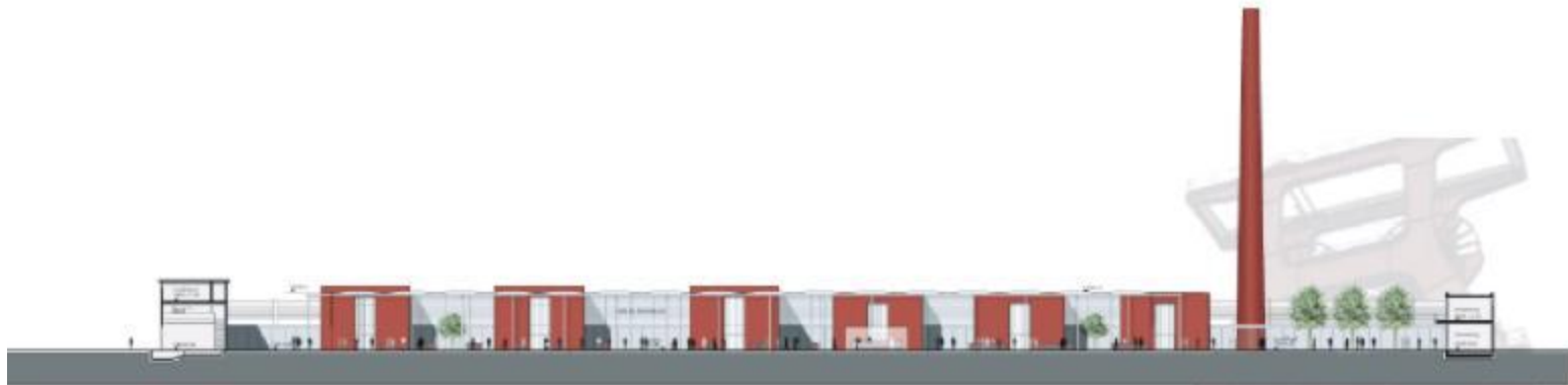
Längsschnitt M 1:200