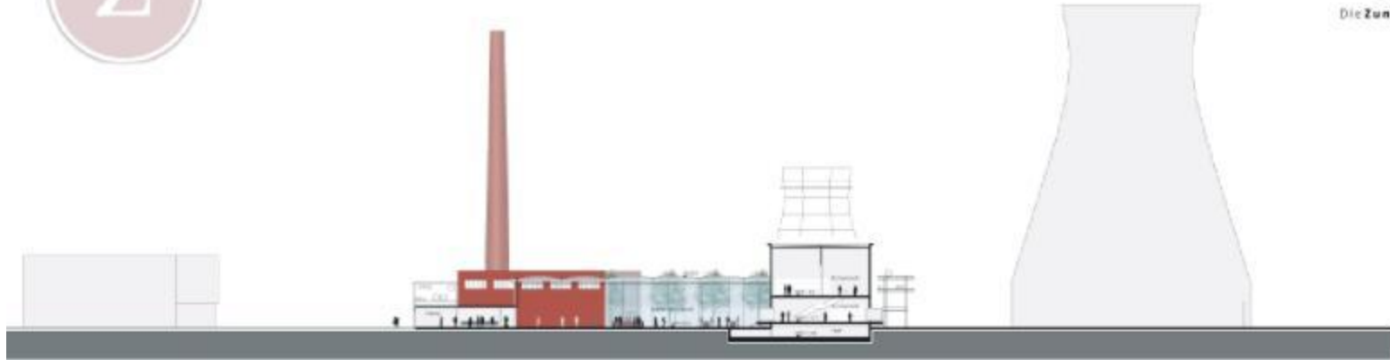
Querschnitt M 1:200